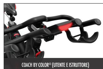
COACH BY COLOR® (UTENTE E ISTRUTTORE)