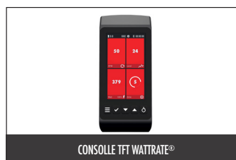
CONSOLE TFT WATTRATE®