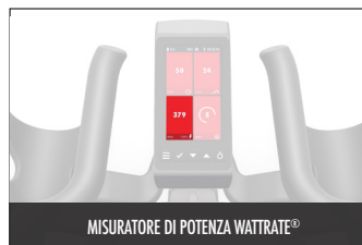
MISURATORE DI POTENZA WATTRATE®