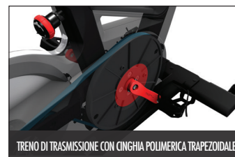
TRENO DI TRASMISSIONE CON CINGHIA POLIMERICA TRAPEZOIDALE