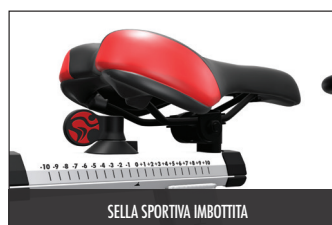
SELLA SPORTIVA IMBOTTITA