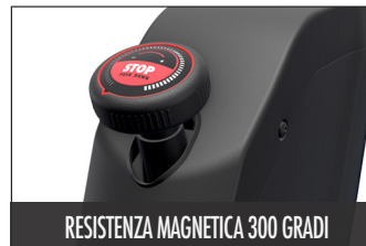
RESISTENZA MAGNETICA 300 GRADI