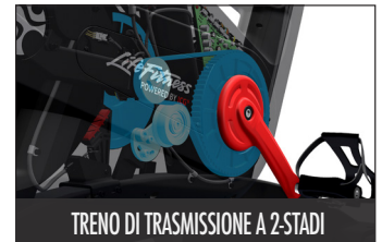
TRENO DI TRASMISSIONE A 2-STADI