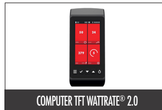
COMPUTER TFT WATTRATE® 2.0