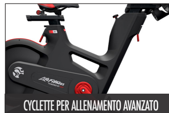
CYCLETTE PER ALLENAMENTO AVANZATO