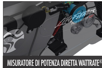
MISURATORE DI POTENZA DIRETTA WATTRATE®