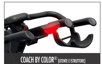
COACH BY COLOR® (UTENTE E ISTRUTTORE)