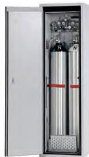
MODELLO DA 205x60cm